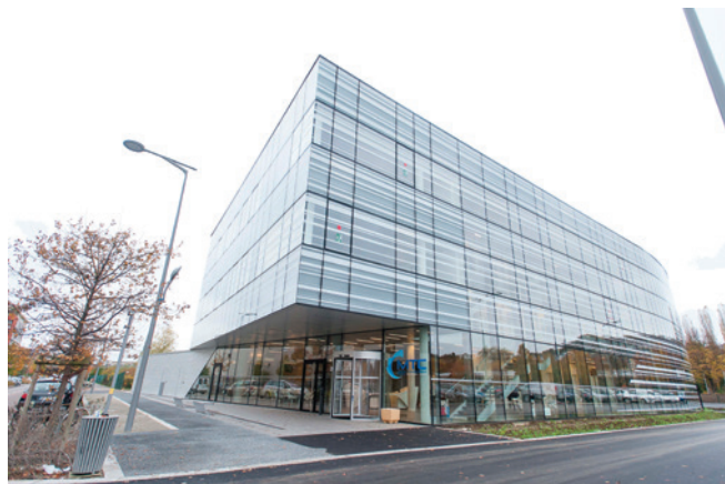
MTC ©CHU Rouen