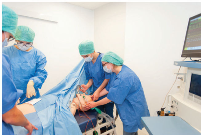
MTC ©CHU Rouen

Les secteurs de la santé et du travail social représentent 15,3 % de l'emploi total normand et sont particulièrement dynamiques, offrant des emplois très diversifiés et non délocalisables.